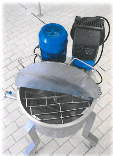
Mélangeur sur bac mobile

Mise en place de module d'agitation pour maintien des terres de filtres en suspension.