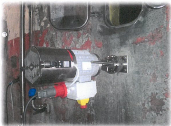
Agitation hélice rétractable.